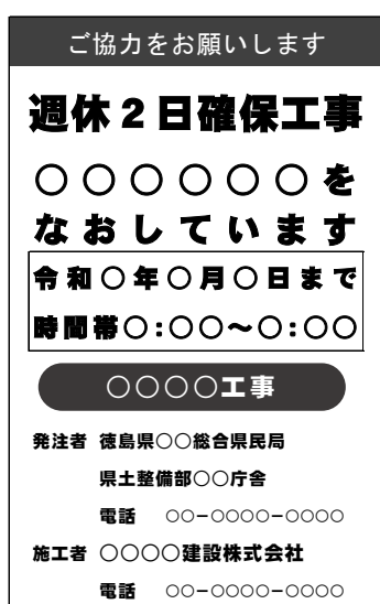
(標示板記載例) 月単位の場合

徳島県 HP https://www.pref.tokushima.lg.jp/jigyoshanokata/kendozukuri/kensetsu/5016115/